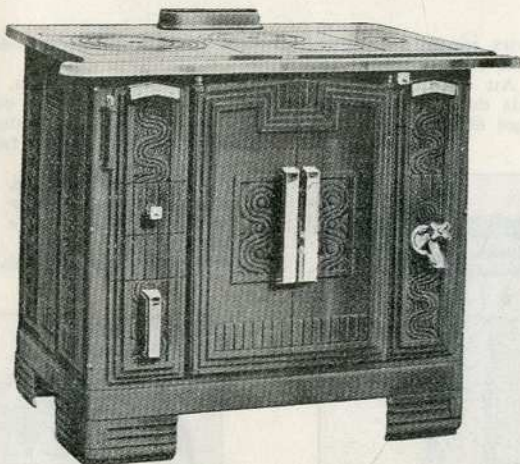
Cuisinière " La Surmoblée "

Grâce à l'énergie de ses dirigeants et de leurs collaborateurs, les USINES DU PIED-SELLE, dont l'œuvre de reconstitution commença dès le début de 1919, purent, dans un temps relativement restreint, être en état de livrer à leur clientèle leurs nouveaux modèles.